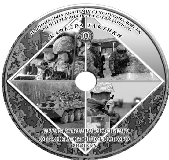
Рис. 8. Інтерактивний електронний посібник з дисципліни «Організація військового зв'язку»

Інтерактивний електронний посібник з дисципліни «Організація військового зв'язку» укладений таким чином, що дозволяє курсантам не лише вивчати новий та повторювати засвоєний матеріал, але й перевірити рівень засвоєння вивченого матеріалу шляхом виконання тестових завдань. Цьому сприяє наявність у посібнику блока рефлексії.