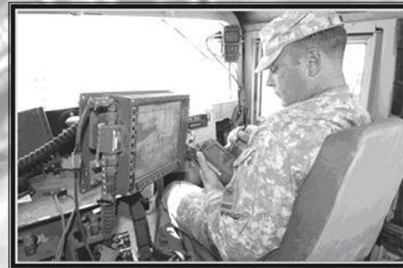
Рис. 11. Фрагмент презентації лекції «АСУ та геоінформаційні системи в Збройних Силах України та провідних країнах світу»