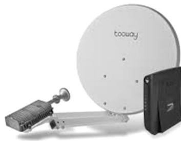
Рис. 2. Термінал супутникового зв'язку TOOWAY