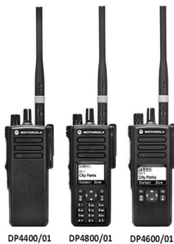
Рис. 1. Радіостанції MOTOROLA

1) вивчення сучасних цифрових засобів транкінгового зв'язку Motorola (радіостанції DP 4400, DP 4800, DM 4600 (рис. 1), ретранслятор DR 3000), станції супутникового зв'язку Tooway (рис. 2), засобів радіозв'язку Harris, Aselsan (рис. 3–5), телекомунікаційних комплектів, а також сучасних засобів зв'язку та комутації вітчизняного виробництва сімейства «Акація» [2, 3, 4, 5].