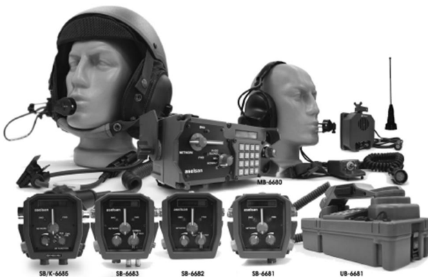
Рис. 4. Апаратура внутрішнього зв'язку та комутації