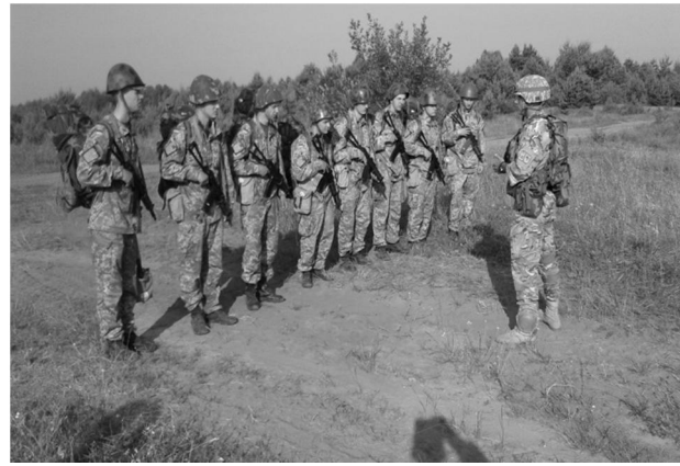
Рис. 10. Заняття з дисципліни «Організація військового зв'язку» (польовий вихід)

8) Метод творчого пошуку (дослідження). Метод застосовується при виконанні творчих завдань під час занять військово-наукового гуртка «Радист».