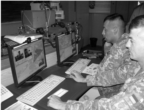
Рис. 6. Робота курсантів із сучасними цифровими засобами зв'язку на заняттях з дисципліни «Організація військового зв'язку»