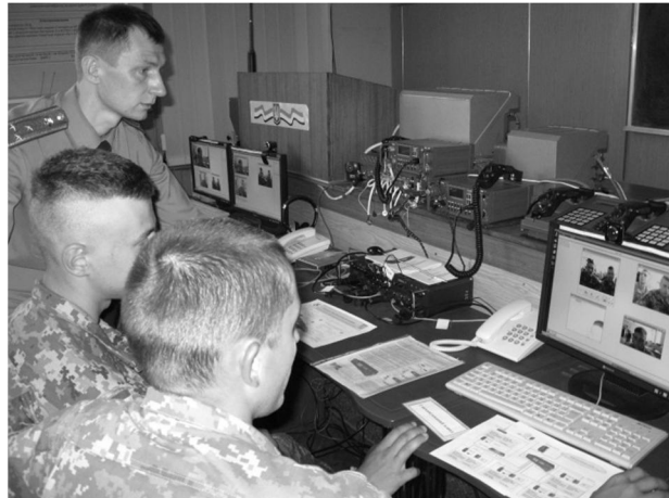
Рис. 7. Клас викладання дисципліни «Організація військового зв'язку»

2) е-контент: використання електронних підручників та посібників (інтерактивний електронний посібник «Організація військового зв'язку») (рис. 8).