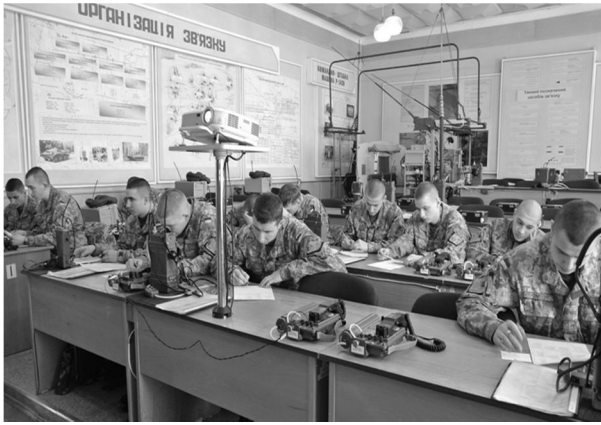
Рис. 9. Заняття з дисципліни «Організація військового зв'язку» (практичне заняття)

4) Моделивання процесів управління підрозділами та організації зв'язку (базується на основі найновітніших розробок вітчизняного та іноземного виробництва АСУ «Славутич», ArcGis).