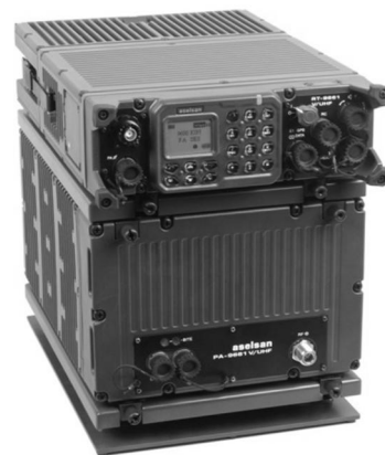
Рис. 5. Радіостанція ASELSAN

Під час вивчення сучасних цифрових засобів зв'язку використовується особистісно-орієнтований підхід, спрямований на «відточення» практичних навичок користування новітніми засобами зв'язку (рис. 6, 7). Специфіка викладання дисципліни полягає у викладанні