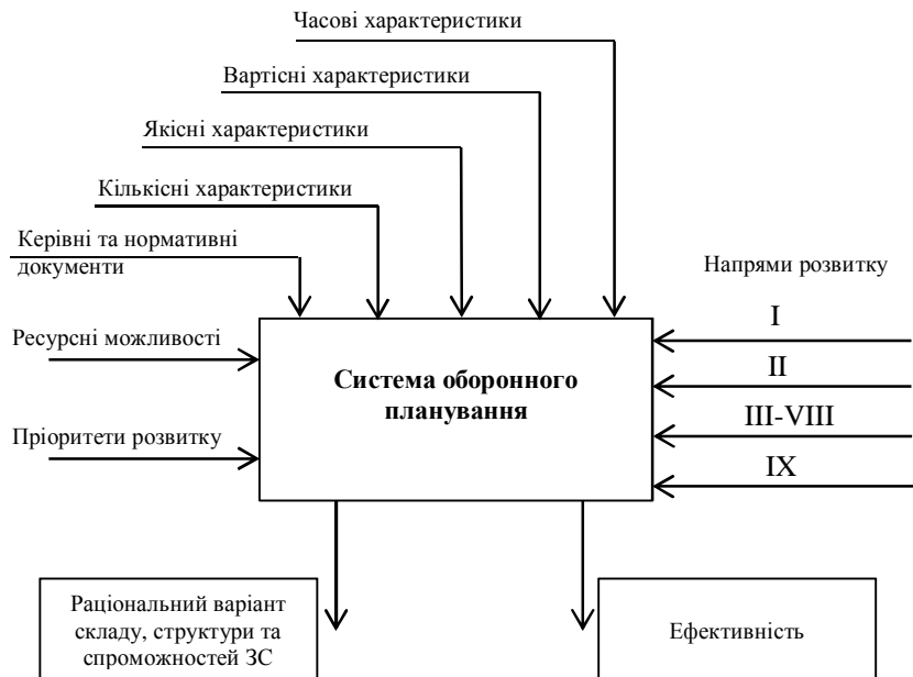
Рис. 2. Модель “білої скриньки” системи оборонного планування

можна оцінити вплив визначених завдань планування, враховуючи характеристики системи.