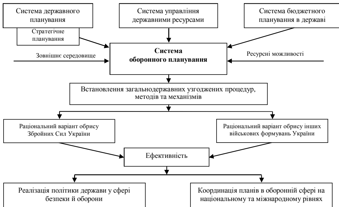
Рис. 4. Система оборонного планування в Україні

Визначення “інтегративна” передбачає поєднання результатів або процедур декількох систем, тобто ОП претендує на поєднання на своєму рівні дії трьох державних систем планування. Місце такої системи має бути відповідне до місця та ролі тих завдань, які вона призначена виконувати.