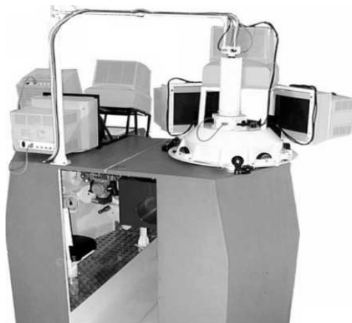
Рис. 2. ТМ підготовки обслуги 152 мм пушки-гаубиці «Дана» чеського виробництва

Процес моделювання візуального зображення бойової обстановки в умовах ТМК буде містити в собі декілька етапів та залежати, головним чином, від обраної форми навчання, теми заняття та навчальних питань, які планується відпрацювати в його ході, рівня навченості тих, хто залучається на заняття, та здійснюватися в декілька етапів.